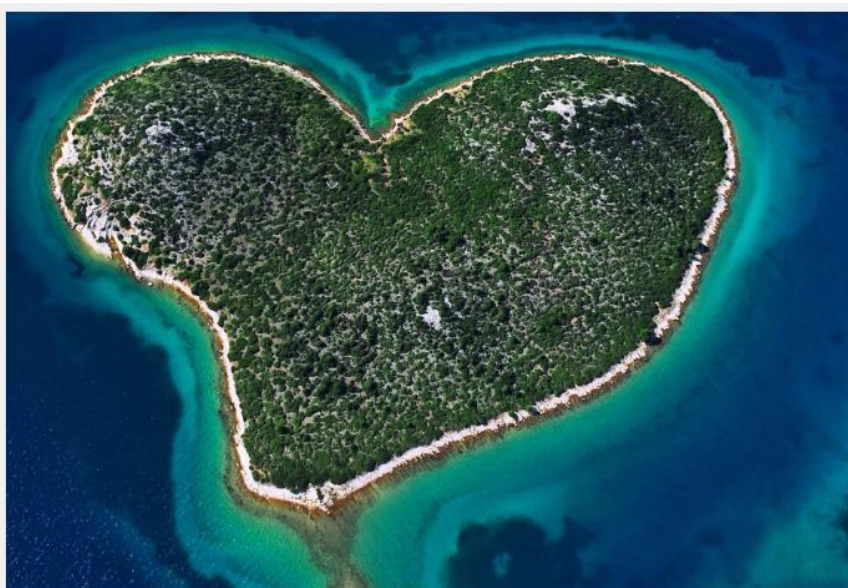
Het Mooiste Blauw eiland

Hierdoor is bij onze teammissie één Mooiste Blauw eiland ontstaan om te zorgen voor verbinding en één eiland te vormen met elkaar. Een eiland dat vervolgens weer in verbinding staat met de wereld om hem heen.